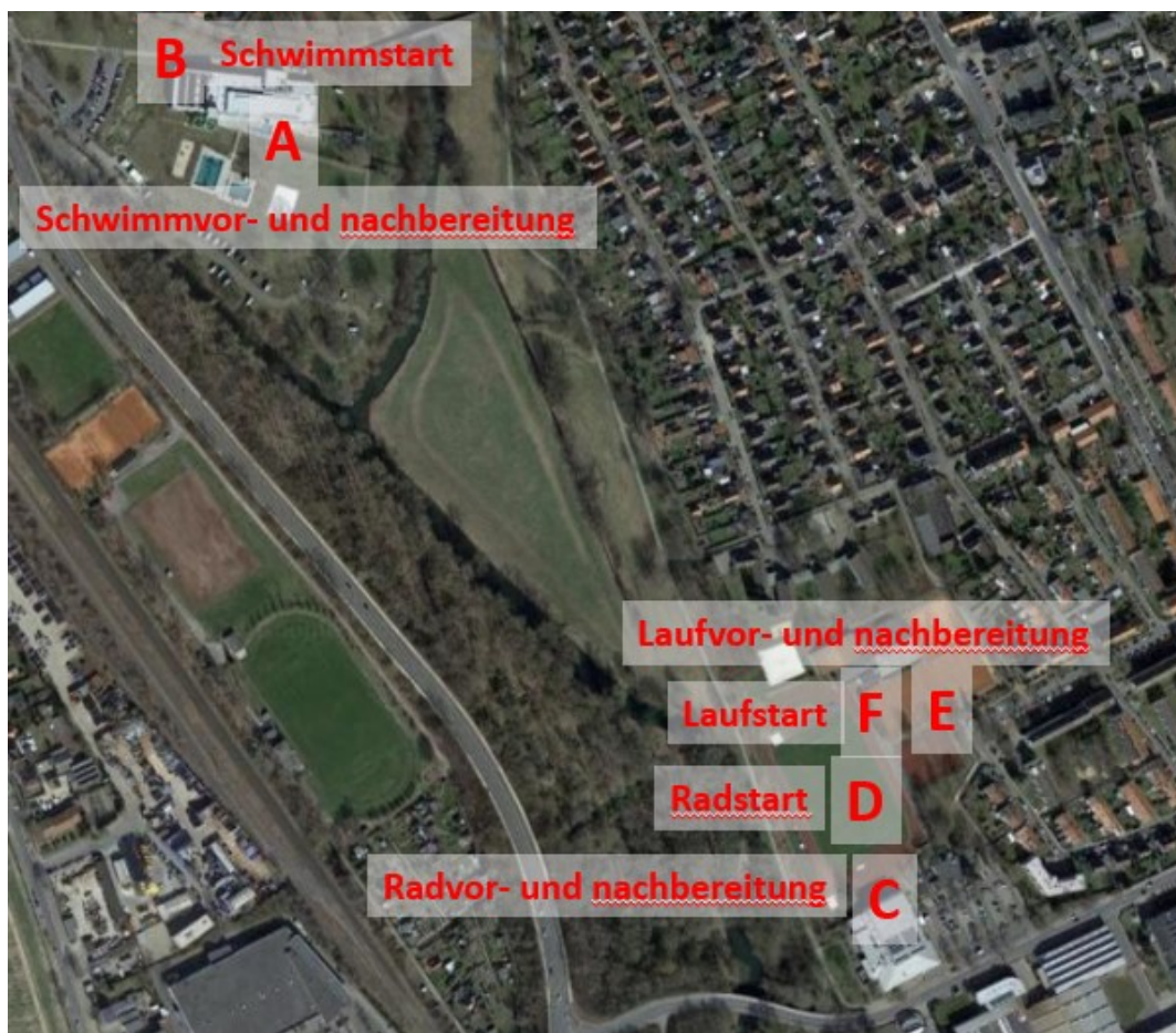
Schwimmbad Okerawe und Sportplatz Halberstädter Straße